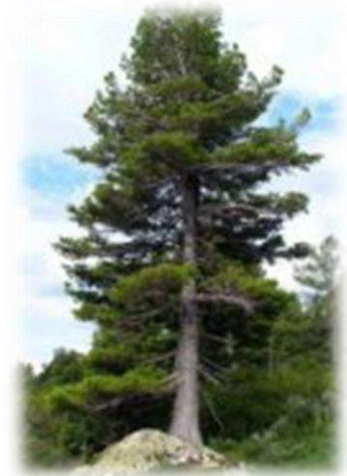
Листваница и кедр