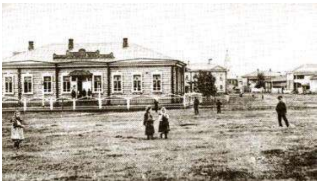
Усть-Сысольск на рубеже XIX - XX вв. Снимки из фондов КРКМ. Народный дом общества трезвости, где устраивались лекции, театральные постановки, концерты.