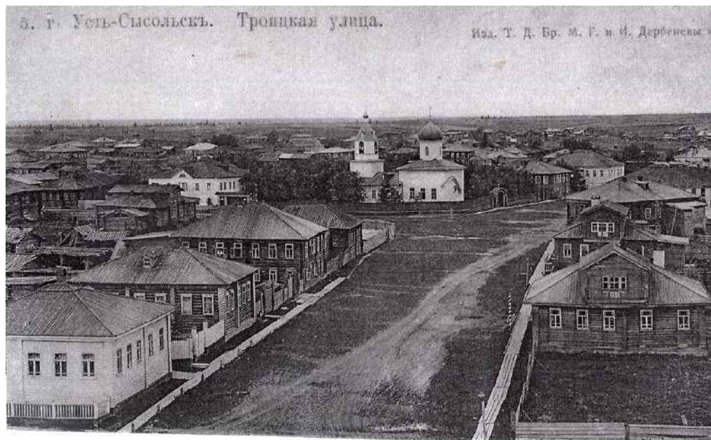
Троицкая улица (ныне ул. Ленина). Видно подворье Ульяновского монастыря с церковью и гостиничным домом. Снимок начала XX века.