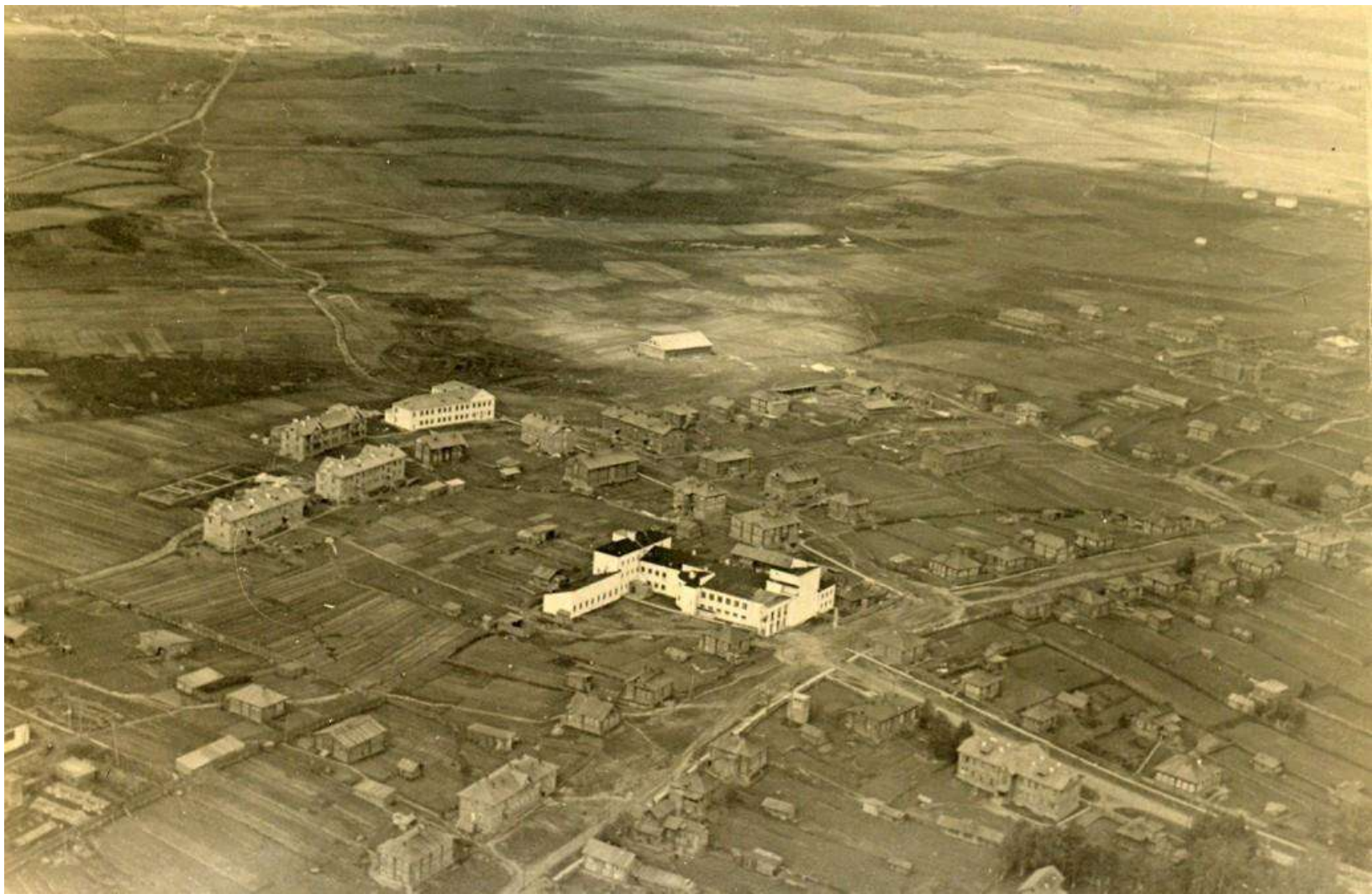
Вид города. Перекресток улиц Первомайская и Бабушкина. В центре – драматический театр. Фотосъемка с самолета. 1946 г.