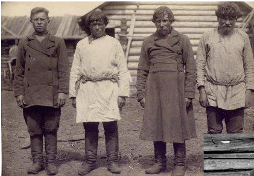
В состав Русского государства входят в 1472 г.