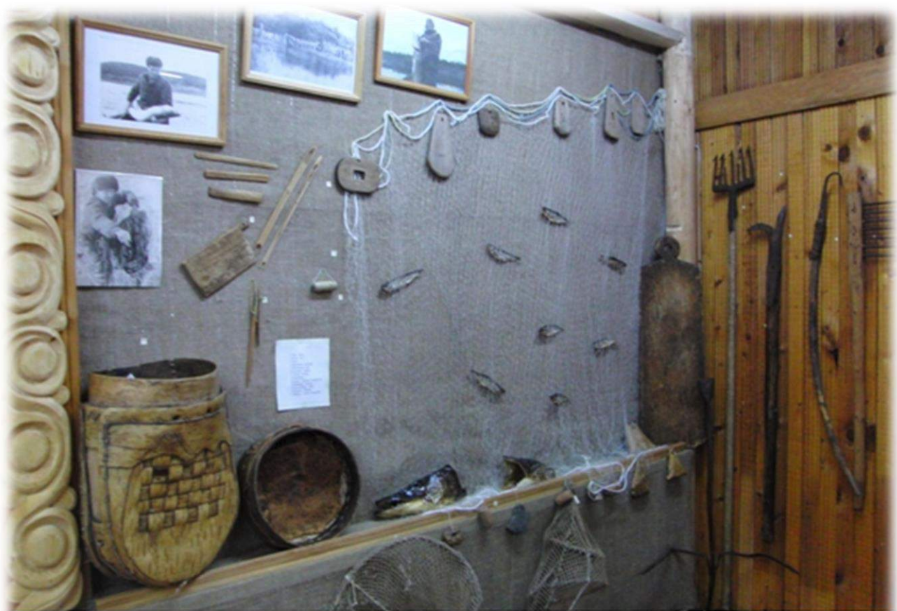
Краеведческий музей с. Кослан. 2013 год.