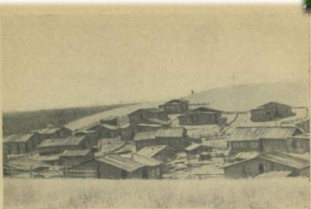
Рис. 3. Беспорядочное расположение построек (дер. Нижний Удор).