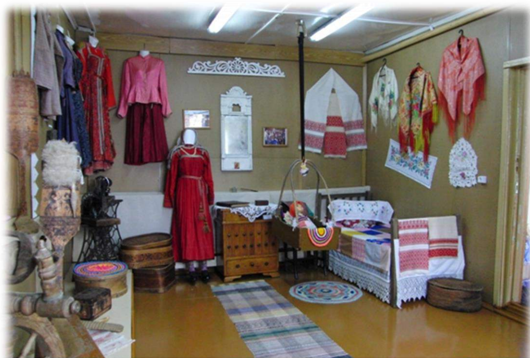
Краеведческий музей с. Кослан. 2013 год.