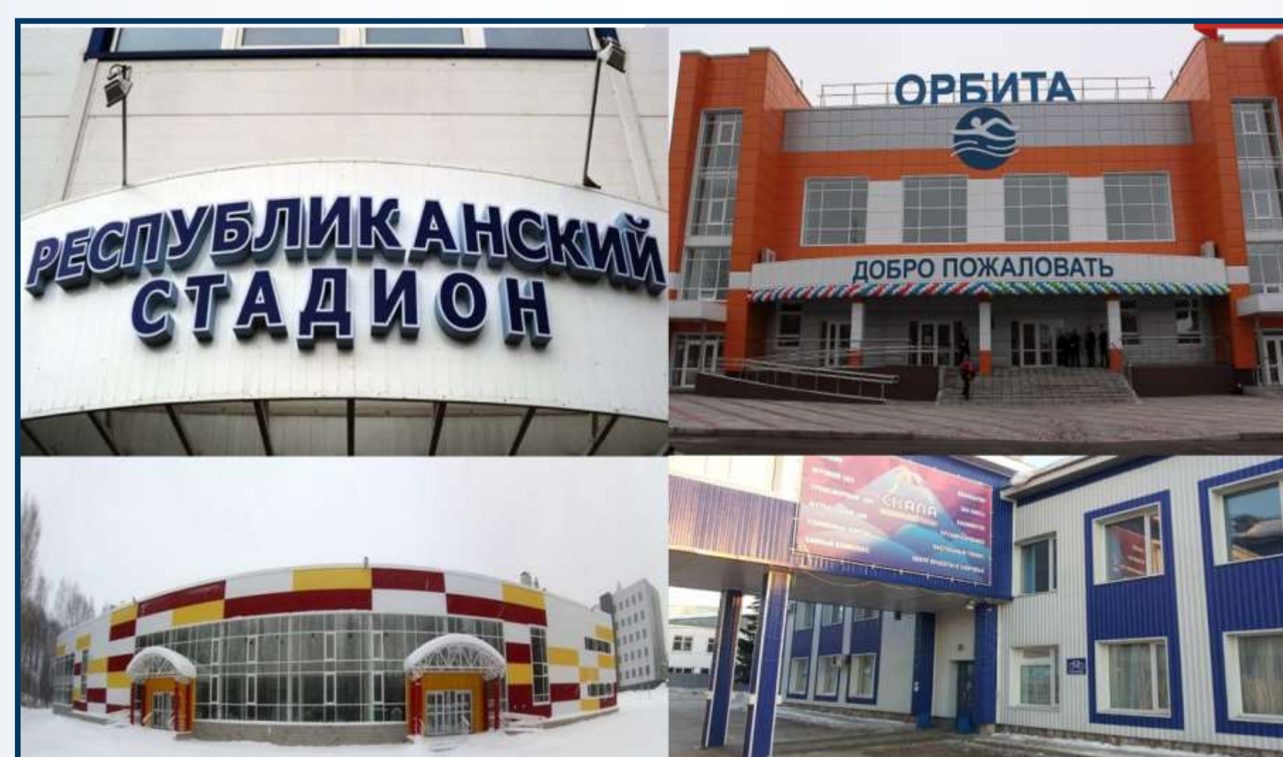
Спортивные сооружения г. Сыктывкар

Вывод: Проанализировав данную тему можно сказать что, решение проблем развития физической культуры и спорта в городе Сыктывкаре, несомненно, требует комплексного и системного подхода, и будет проходить гораздо эффективней при принятии и успешной реализации отдельной подпрограммы в составе муниципальной программы.